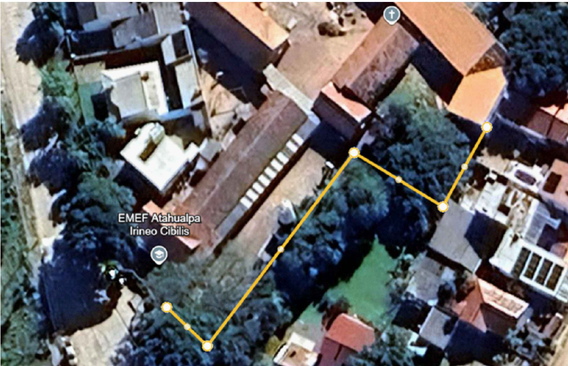
PERÍMETRO DO MURO